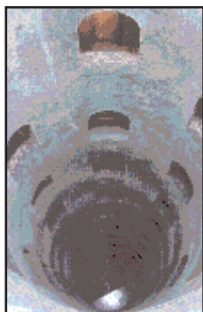
Il pozzo di San Patrizio

Nel 1527, all'indomani del sacco di Roma, il Papa Clemente VII si rifugiò ad Orvieto. Per approvvigionare d'acqua la rocca dell'Albornoz, in caso di assedio o conflitto, fu edificato il pozzo di San Patrizio, su progetto di Antonio da Sangallo il Giovane. Terminato nel 1537, il pozzo è profondo circa 62 metri e, al suo interno, sono state realizzate due scalinate a doppia elica sovrapposte, così progettate per rendere più agevole il trasporto dell'acqua.