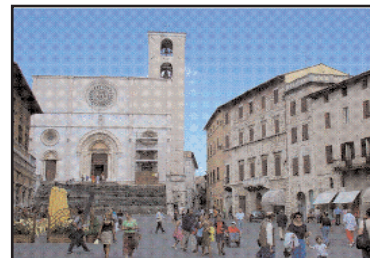
Piazza del popolo

alte navate. Al centro si nota la statua del santo, ai lati si trovano varie cappelle ed affreschi. Dietro alla statua c'è un coro in noce con stupendi intarsi che ricopre tutta l'abside centrale. Scendendo nella cripta si trova la tomba di marmo di S. Fortunato e la lapide di Jacopone. Dalla sagrestia si sale sull'alto campanile dal quale si ammira il panorama della città fra il verde delle colline.