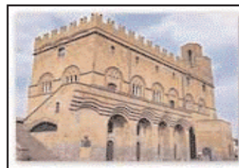
Palazzo del Capitano del popolo

sacri tra cui spicca il celeberrimo Duomo , risalente al 1263, indubbiamente la testimonianza architettonica più importante della città, con la sua splendida facciata gotica e con la ricchezza delle decorazioni e delle cappelle interne.